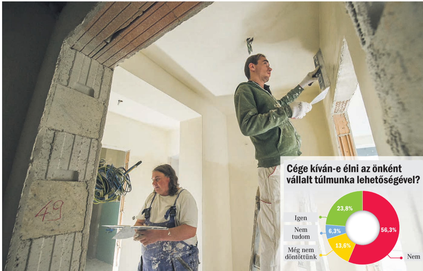
Az építőiparban bőven van most munka, de a cégek a saját érdekeik alapján alkalmazzák a túlóraszabályt

TÚLMUNKA A cégek többsége nem él a törvény adta lehetőséggel