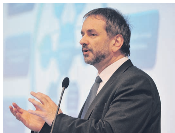
Pomázi Gyula, az Innovációs és Technológiai Minisztérium Iparági Stratégiáért és Szabályozásért Felelős helyettes államtitkára

Arra is felhívta a figyelmet, hogy a világ kereskedelmének a 80 százalékát 600 globális értéklánc adja. Rávilágított előadásában, hogy a termelővállalkozások nem fordítanak kellő figyelmet az adataik védelmére. Ezek pedig stratégiai jellegűek a piaci versenyben. Etikus hackerek véleménye szerint elég 7,5 perc ahhoz, hogy feltörjék egy viszonylag kevésbé védett cég adathálózatait. A kormánytag tájékoztatóját Pleschinger Gyula, a Monetáris Tanács tagjának előadása követte, aki az MNB gazdaságban játszott szabályozó szerepéről beszélt. Említette, hogy bár tavaly csaknem 5 százalékkal gyorsult a gazdaság, az idén és a következő két évben csökken a fejlődés üteme. Becslése szerint lehet reálisan számolni, jövőre pedig inkább 3 százalékkal. Ez